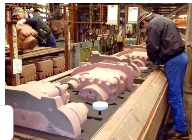
Produzione getti in ghisa ad alto Si