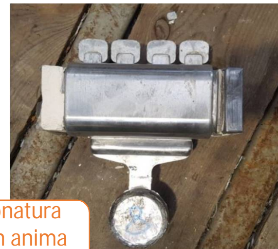
Campionatura getti con anima ceramica